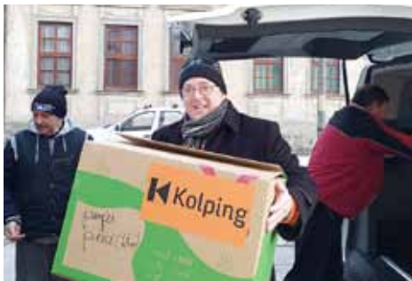
Übergabe einer Hilfslieferung des ungarischen Kolpingwerks an der rumänisch-ukrainischen Grenze.

Im Geiste Adolph Kolpings zusammen für den Frieden in der Ukraine