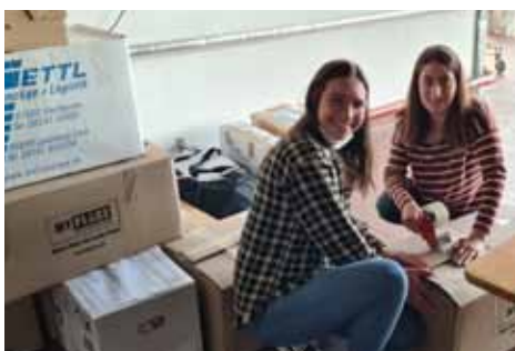
Nicht nur zahlreiche Spender kamen vorbei, sondern auch jede Menge Helfer, die die Waren entgegen nahmen und für den Weitertransport verpackten.

Mehrere Kolpingsfamilien richten Sammelstellen ein