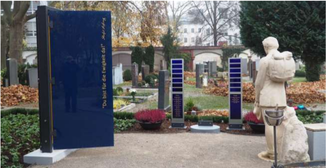
Bild des Gemeinschaftsgrabes von Kolping auf dem Hermannfriedhof in Augsburg

Im November 2021 wurde das neu gestaltete Kolping-Gemeinschaftsgrab auf dem Hermannfriedhof in Augsburg gesegnet.