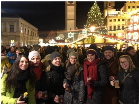
Gemütlicher Ausklang nach der Team-Sitzung im Dezember 2019 - dieses Jahr leider ohne Christkindlesmarkt und in digitaler Form.

Im vergangenen Berichtsjahr fanden zwei Gruppenleitungsgrundkurse statt, die Blockwoche im Herbst und der Wochenendkurs im Frühjahr. Neben diesen bieten wir eine Vielzahl an DVonTour-Angeboten mit den unterschiedlichsten Schulungsinhalten an und fordern und fördern so die Fähigkeiten der Kolpingjugendlichen. Auch diese konnten im vergangenen Jahr nur eingeschränkt stattfinden.