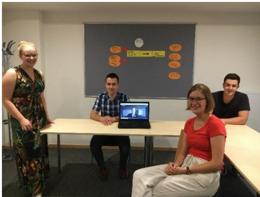
Ein Teil der PG bei der Arbeit.

Bei der Herbst-Diözesankonferenz 2019 wurde ein Antrag zum Thema „digitaler Erstversand“ gestellt. Da dieses Thema sehr umfangreich ist, hat die Diözesanleitung die Projektgruppe Digitaler Erstversand ins Leben gerufen, die sich nun mit allen Details beschäftigt. Im Team sind sowohl Antragstellende als auch Mitdiskutierende vertreten.