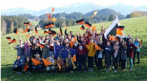
Kolping zeigt Flagge!

// 66 Teilnehmende, davon 54 stimmberechtigt