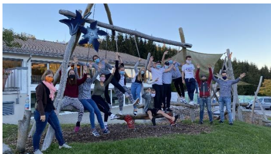
The Masked Gruppenleiter*in Staffel Herbst 2020

Im vergangenen Berichtsjahr fanden zwei Gruppenleitungsgrundkurse statt, die Blockwoche im Herbst und der Wochenendkurs im Frühjahr. Neben diesen bieten wir eine Vielzahl an DVonTour-Angeboten mit den unterschiedlichsten Schulungsinhalten an und fordern und fördern so die Fähigkeiten der Kolpingjugendlichen. Auch diese konnten im vergangenen Jahr nur eingeschränkt stattfinden.