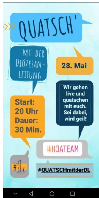
Bewerbung in der Instagram-Story

Ein erster Testlauf Ende Mai verlief gut, aber es braucht noch etwas Nachjustierung, bis ein regelmäßiges Angebot daraus entstehen konnte. Geplant ist, ab Herbst immer wieder einen Live-Chat anzubieten und bei guter Resonanz dieses Format auch beizubehalten.