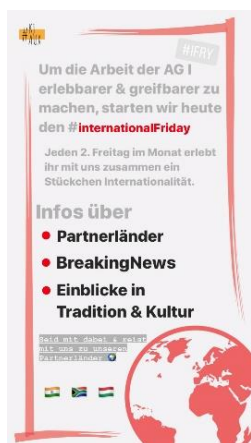
Der International Friday – kurz iFRY

Unsere Zielgruppe ist jede*r Jugendliche und junge*r Erwachsene*r, der*die sich für internationale Themen und die Kontakte zu unseren Partnerländern interessiert. Der Schwerpunkt unserer Arbeit liegt klar bei den Partnerschaften zu Südafrika, Indien und Ungarn. Leider musste unsere Highlight-Veranstaltung, die Jugendbegegnung in Augsburg, verschoben werden. Dennoch waren wir fleißig und haben das Thema Internationales durch den neu eingeführten #iFRY und unseren Street-View-Lauf auch im Jahr 2020 verankert.