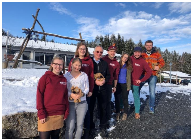
Die aktuelle Diözesan- leitung bei der Klausur 2020.

Die Diözesanleitung (mit Kolpingsfamilie und Amtszeit) setzte sich somit in vergangenen Berichtsjahr wie folgt zusammen: