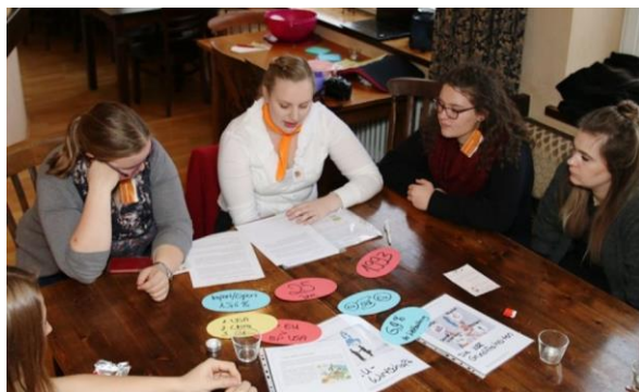
Bei der Station Wirtschaft kommen viele spannende Fakten zum Vorschein.