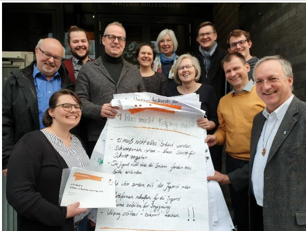
DiözesanPRÄSIDIUM meets BundesPRÄSIDIUM