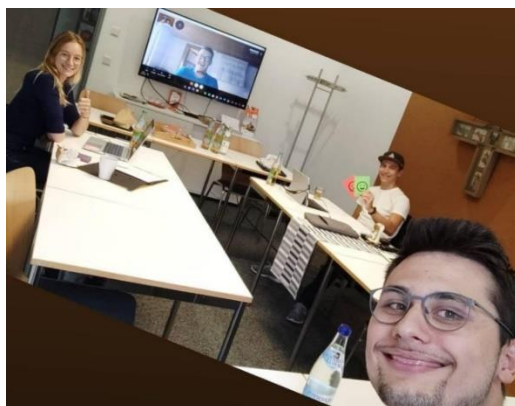
Ein Teil des WAU bei der Arbeit.

Unser Auftrag als Wahlausschuss ist die Vorbereitung und Durchführung der Wahlen an der Diözesankonferenz. Zusätzlich zu dieser Aufgabe haben wir uns dieses Jahr intensiver mit der Wahl- und Geschäftsordnung (WGO) beschäftigt, um die Wahlabläufe und die WGO transparent und verständlich zu erklären. Außerdem behandeln wir das Thema Nachhaltigkeit in Bezug auf die Stimmungskarten.