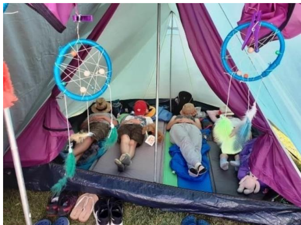
Eines der aufgeschlagenen Lager.

Die 90er wurden unter anderem auch in einer Gameshow erforscht.