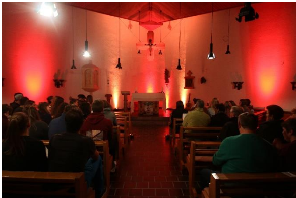
Die stimmungsvoll beleuchtete Hauskapelle beim Gottesdienst der Diözesankonferenz

Eine Brücke zwischen Leben und Glauben zu schlagen, ist der Auftrag der Arbeitsgruppe. Dabei ist es wichtig, verschiedene Plattformen zu nutzen, um beim Gottesdienst während der Diözesankonferenz und anderen Veranstaltungen genauso wie über Instagram viele (Kolping)Jugendliche und Junggebliebene sowohl im Alltag als auch bei ganz bestimmten Highlights anzusprechen und zu erreichen.