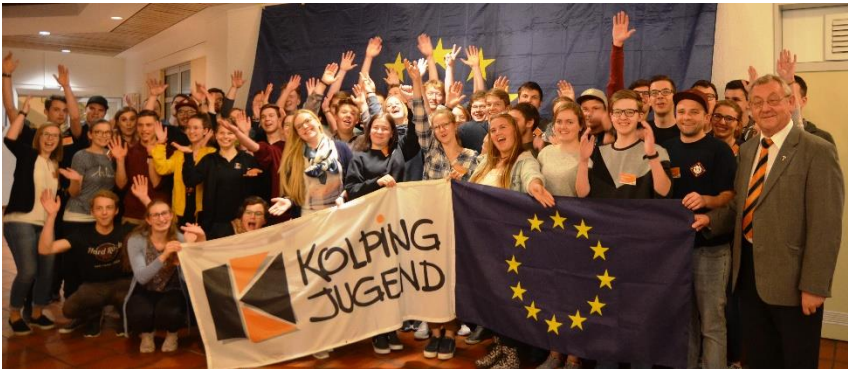
Glückliche Gesichter nach der „europe experience“ bei der Frühjahrs-Diözesankonferenz 2019